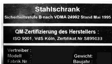
Beispiel Typenschild VDMA-Tresore